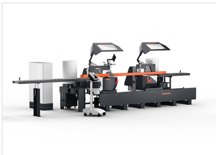
Troncatrice bilama DG 104