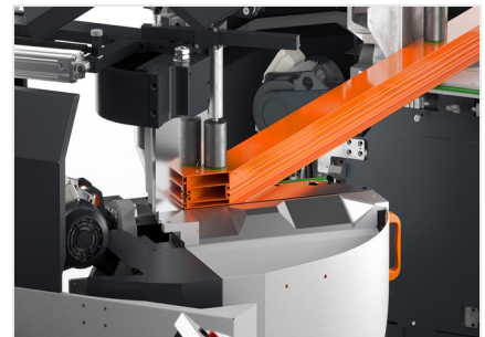
Troncatrice bilama DG 104