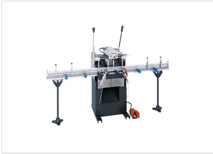
Pantografo a mandrino singolo AS 170/10