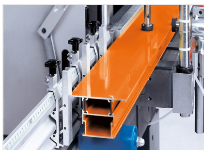
Pantografo a mandrino singolo AS 170/10