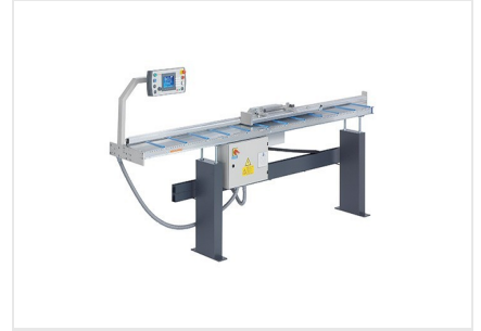
Length stop and measuring system AMS 200 + E 355