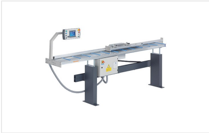
Sistema di battuta e misurazione AMS 200 + E 355