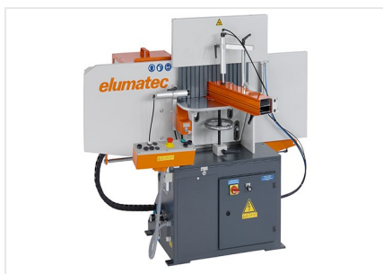
Fresatrice intestatrice AF 223/01