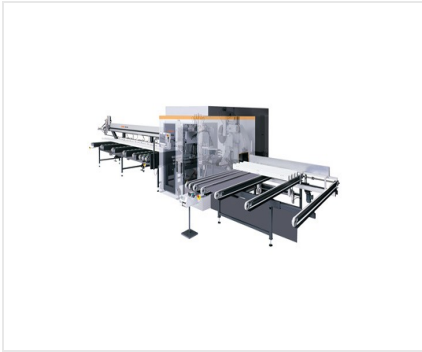
型材加工中心 SBZ 630 SBZ 630/11/L + 选装配件