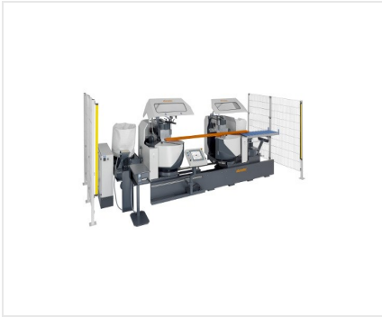
双头斜榫切割机DG 244 带选装配件