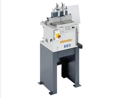
Tablalı Testere TS 161/21