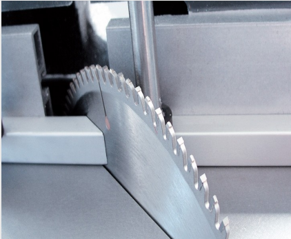
Tablalı Testere TS 161/21