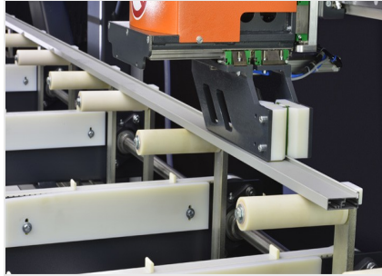
Kesme Merkezi SBZ 616/02