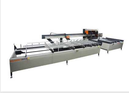
Kesme Merkezi SBZ 616/02