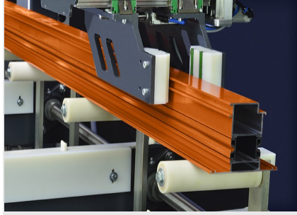
Kesme Merkezi SBZ 616/02