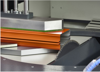
Kesme Merkezi SBZ 616/02