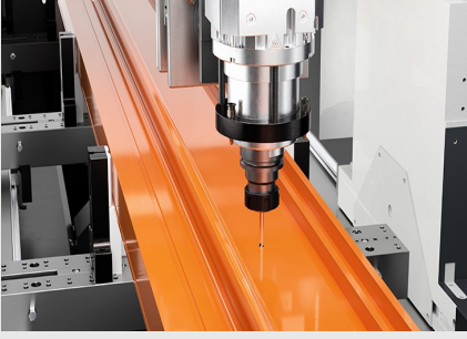
Profil İşleme Merkezi SBZ 141