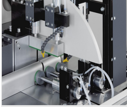
Otomatik Testere SAS 142/44