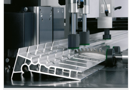
Otomatik Testere SAS 142/44