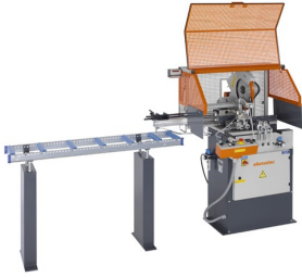
Otomatik Testere SA 73/36