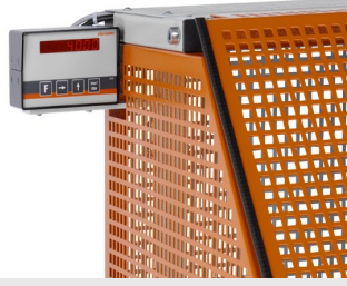
Otomatik Testere SA 73/36