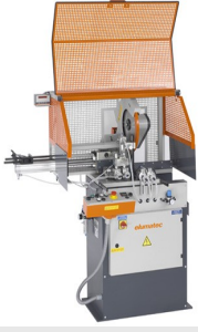
Otomatik Testere SA 73/36