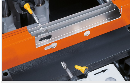
Üç Motorlu Kopya Freze KF 178/10