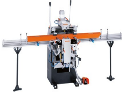
Üç Motorlu Kopya Freze KF 178/10