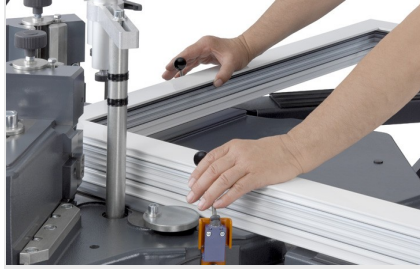
Köşe bağlantı presi EP 124/20