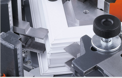
Köşe bağlantı presi EP 124