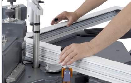
Köşe bağlantı presi EP 124/20 2 elle kullanım