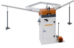
Köşe bağlantı presisi EP 120