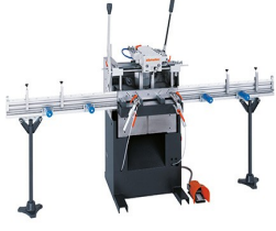
Tek Motorlu Kopya Freze AS 170/10