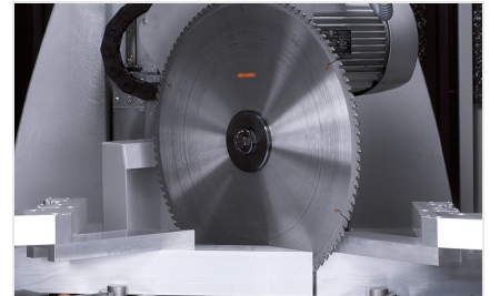
Обработывающий центр SBZ 631