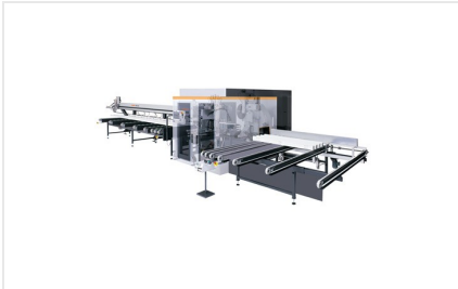
Обработывающий центр SBZ 631