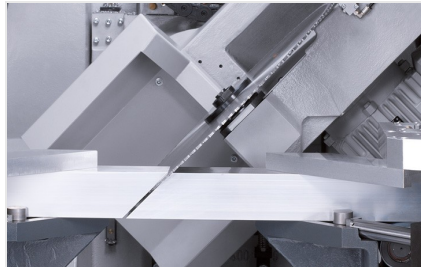
Обработывающий центр SBZ 631