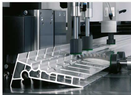
Пильный автомат SAS 142/44