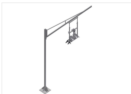
Приборные держатели G 3000 + стальная стойка S 3000