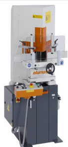
Пила для клиновых и торцевых вырезов KS 101/30