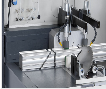
Máquina de corte automática SAS 142/43