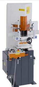
Máquina de corte em V KS 101/30