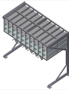
Estante para ferragens BR 40