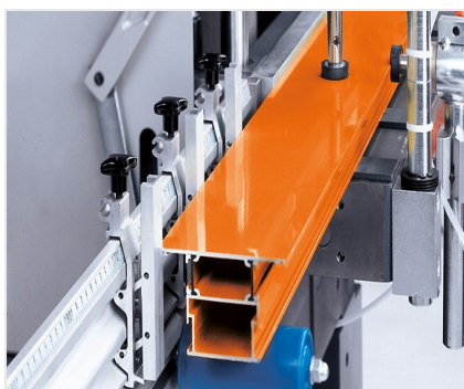
Fresa-copiadora de 1 cabeça AS 170/10