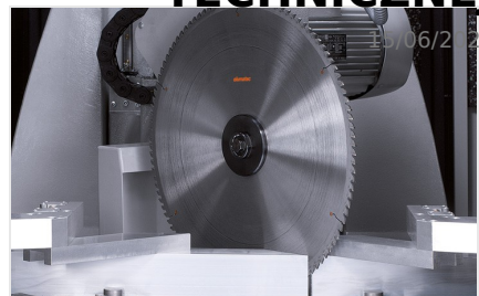
Centrum obróbcze profili SBZ 631