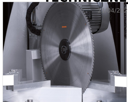
Centrum obróbcze profili SBZ 631