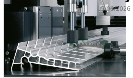
Automat do cięcia SAS 142/44