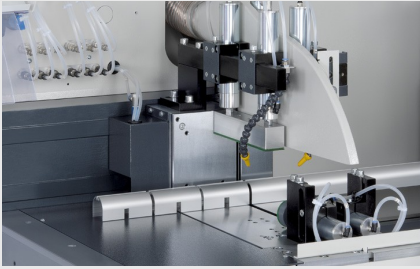
Automat do cięcia SAS 142/44