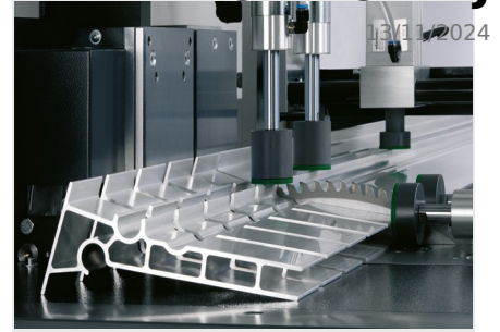
Automat do cięcia SAS 142/44