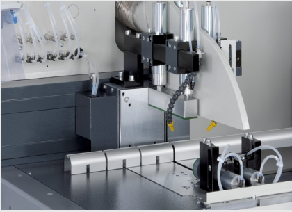
Automat do cięcia SAS 142/44