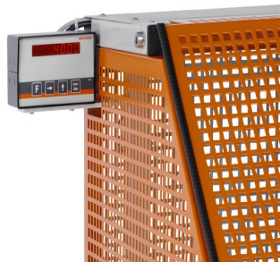
Automat do cięcia SA 73/36