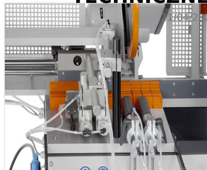
Automat do cięcia SA 73/36