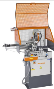
Automat do cięcia SA 73/36