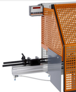
Automat do cięcia SA 73/36