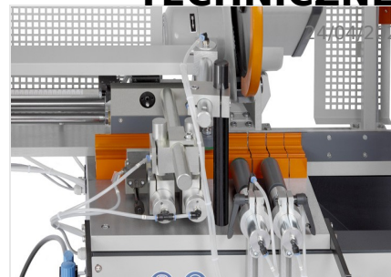
Automat do cięcia SA 73/36