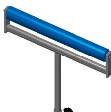
Rolki z tworzywa sztucznego