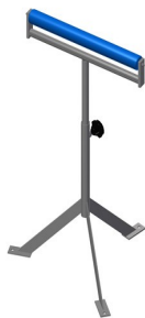
Stojak z rolką MST 1000