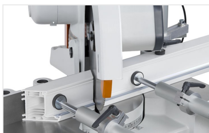
Piła obrotowa MGS 73/33