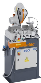
Piła obrotowa MGS 73/33