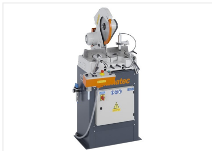
Piła obrotowa MGS 73/33