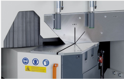
Piła obrotowa MGS 105