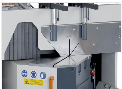
Diagram cięcia DG 105