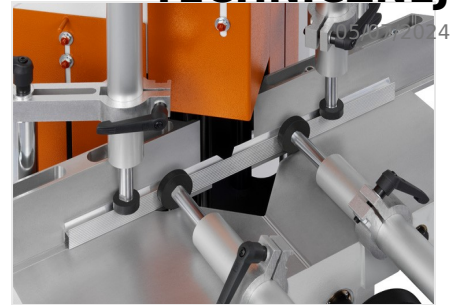
Piła do wycięć klinowych KS 101/30