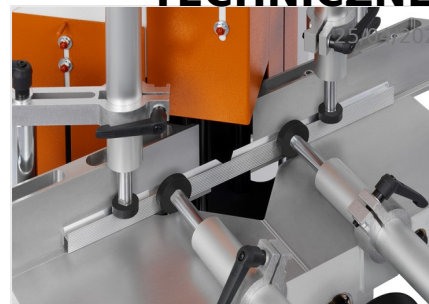
Piła do wycięć klinowych KS 101/30