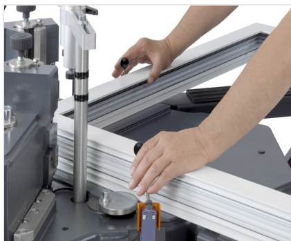
Zaciskarka do naroży EP 124/20