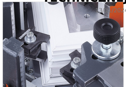
Zaciskarka do naroży EP 124