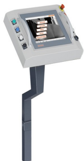
Komputer sterujący E 580