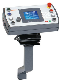
Komputer sterujący E 355