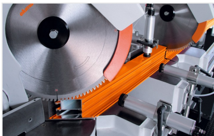
Piła dwugłowicowa DG 79