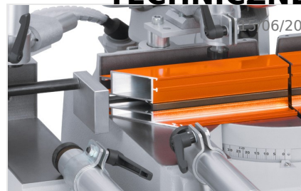
Piła dwugłowicowa DG 79