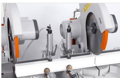
Piła dwugłowicowa DG 79