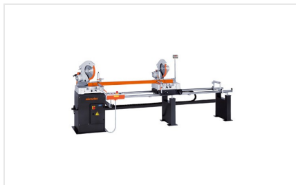
Piła dwugłowicowa DG 79