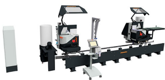
Piła dwugłowicowa DG 104 + E 590

elumatec AG Pinacher Straße, 61 75417 Mühlacker Germany