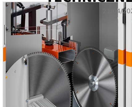
Piły do wycięć klinowych AKS V-550