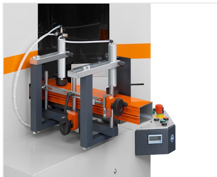
Piły do wycięć klinowych AKS V-550