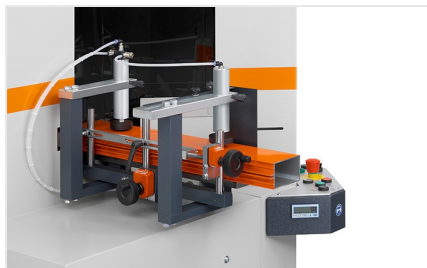
Piły do wycięć klinowych AKS V-550