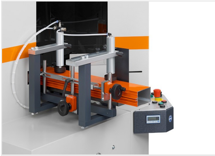
Piły do wycięć klinowych AKS V-550