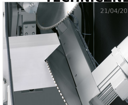
Piły do wycięć klinowych AKS 134/64