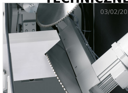
Piły do wycięć klinowych AKS 134/64