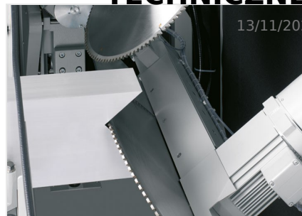
Piły do wycięć klinowych AKS 134/64