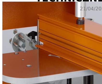
Frezarka do słupków AF 223/01