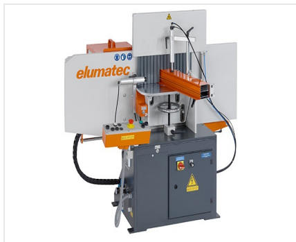
Frezarka do słupków AF 223/01