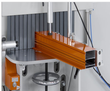
Frezarka do słupków AF 223/01