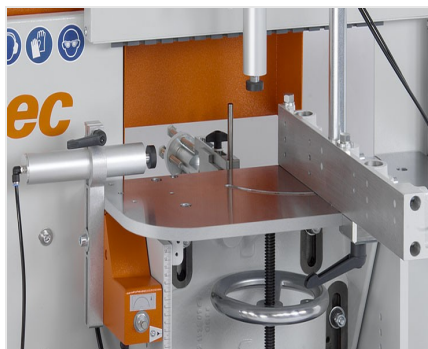
Frezarka do słupków AF 223/01