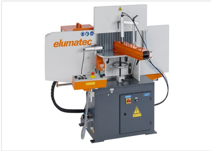
Frezarka do słupków AF 223/01