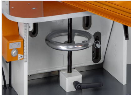
Frezarka do słupków AF 223/01